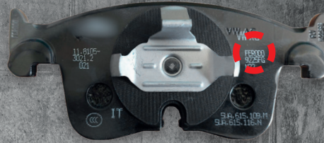
AUDI A3 & VW GOLF VIII