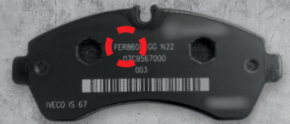
IVECO DAILY 4.2