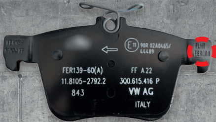
AUDI A3 & VW GOLF VIII