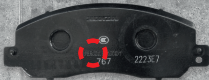
HONDA CR-V (2YC) MJ2022